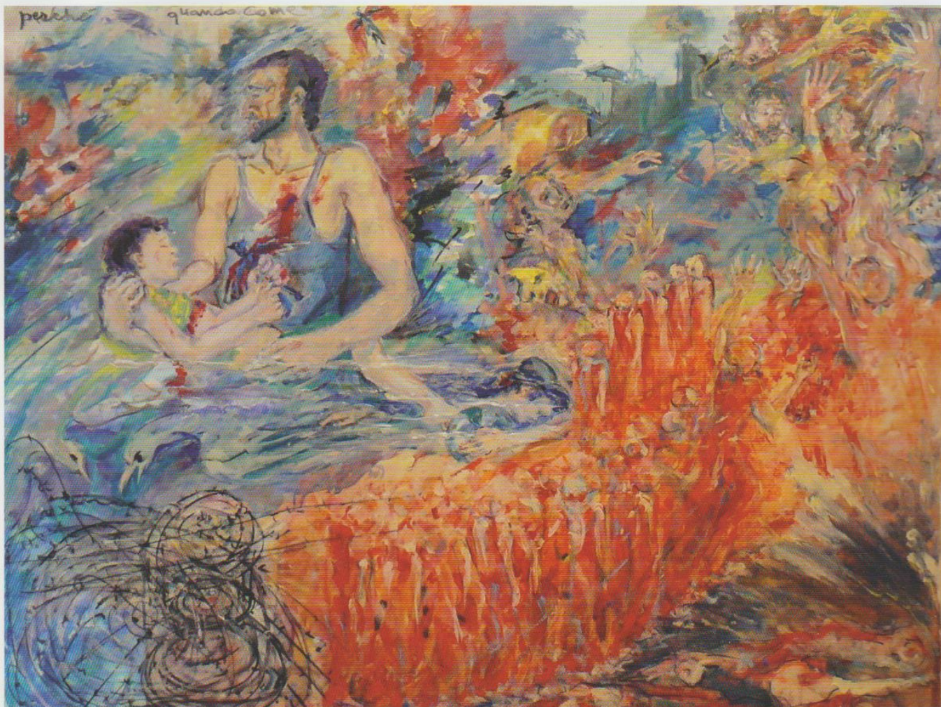
Irragionevoli guerre, disastri oscuri 2016 — tecnica mista, cm 90x120