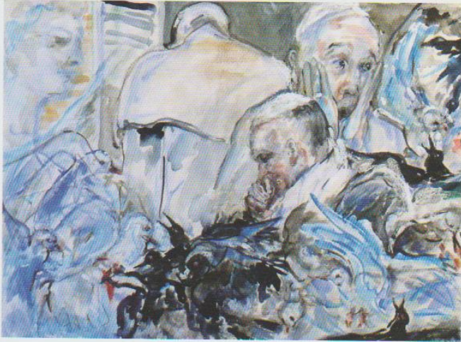
Chi sono io chi siamo noi? 2014 — acquerello su carta, cm 46x62