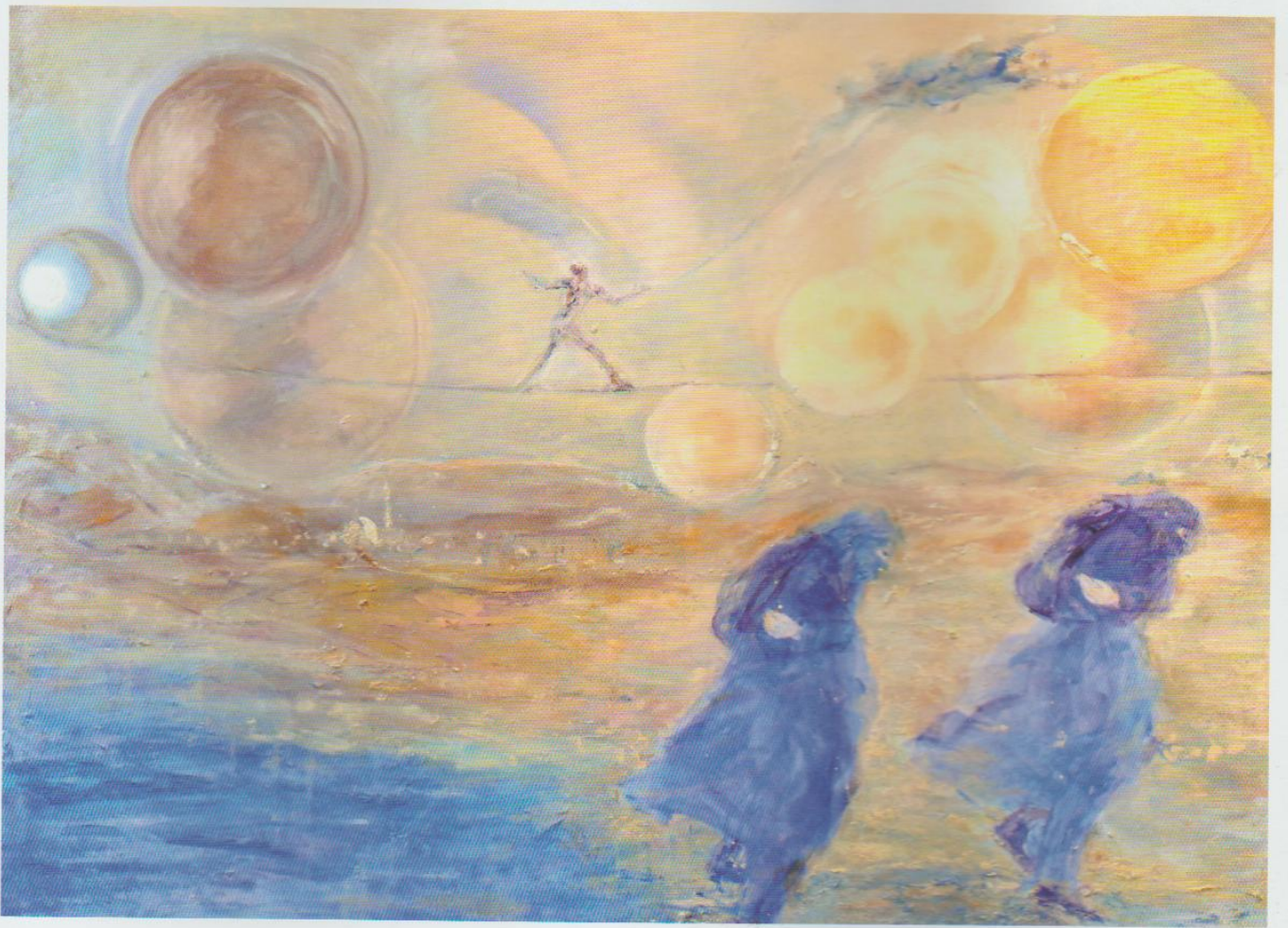
Vento Freddo del rifiuto 2016 — tecnica mista tela, cm 89x119