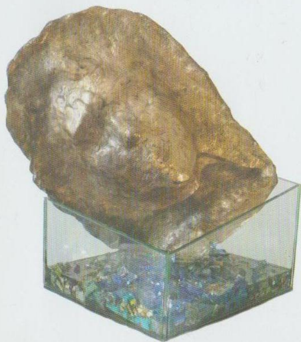
Sperdimento del corpo 2015 — bronzo, mosaici vitrei, teca asimmetrica cristallo, cm 50x34x40