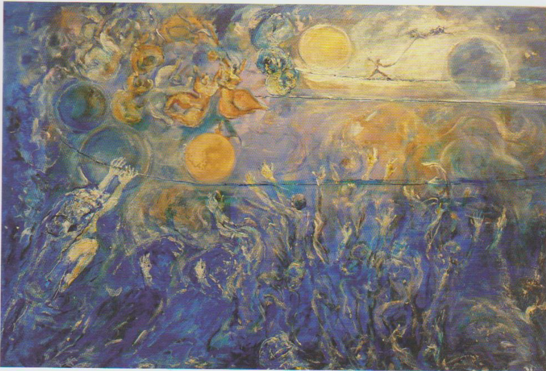
Caos 2016 — tecnica mista, cm 69x97