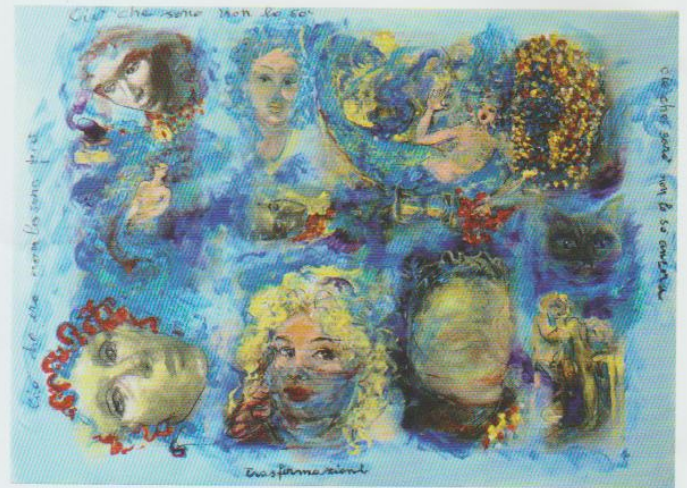
Trasformazioni 2016 — tecnica mista tela cm 95x70