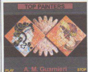
PLAY A. M. Guarnieri STOP

correnti avanguardistiche (come suggeriva, negli anni Venti del Novecento, Bontempelli nella rivista 'Valori Plastici') ma suggellata da elementi surreali. Alfred H. Barr Jr., direttore del Museum of Modern Art di New York, nel 1943 definì il termine Realismo Magico: << ... Opera di pittori che servendosi di una perfetta tecnica realistica cercano di rendere plausibili e convincenti le loro visioni improbabili, oniriche o fantastiche >>. Giampaolo Ghisetti nella propria espressione pittorica accoglie, in un certo senso, tale definizione. Il suo 'Cenacolo' (fig. 4) è prettamente esplicativo di tale concetto: in un gruppo scenico di chiaro stampo leonardesco ma trasferito in un contesto d'epoca contemporanea la realtà della storia evangelica si trasfigura nella fantasia dell'artista attraverso i personaggi: Gesù, giovane uomo del Duemila in camicia, i Dodici in abiti contemporanei conversano in una cena con gatto e